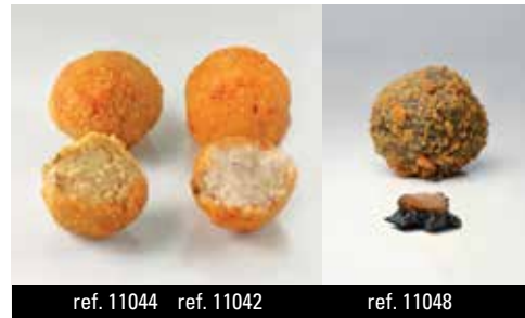
ref. 11044 ref. 11042