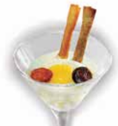
ref. 11014 ref. 11015